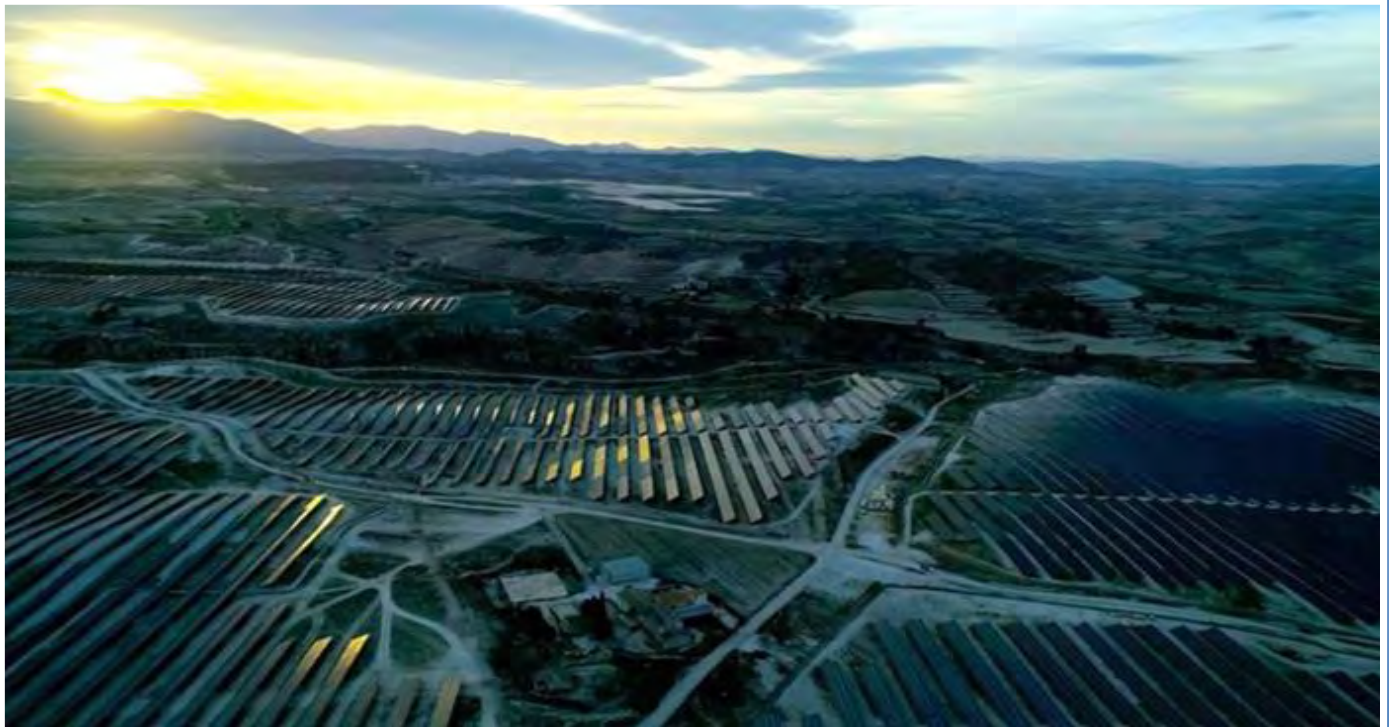
Plantas de Esasolar.ESASOLAR

Durante esta pasada primavera, la fotovoltaica ha alcanzado no solo su mayor volumen de producción, con casi 11,5 GWh, sino también su máxima participación en el mix energético hasta suponer cerca del 18% del total de la electricidad producida superando con creces el 13,6% de la primavera anterior.